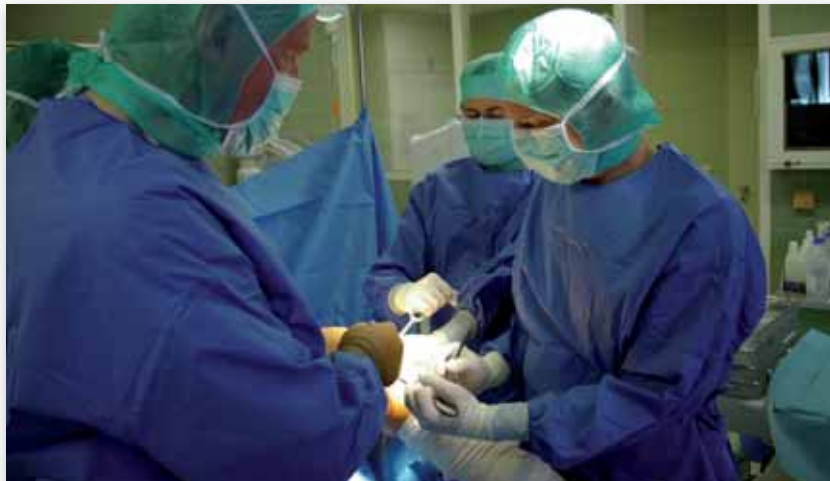
Eine Knorpelzelltransplantation ist ein Verfahren, das nur selten angewandt wird.