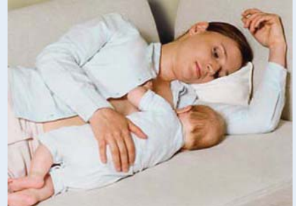
Stillen im Liegen